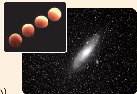
観察天体：月食(写真左)、木星、土星、スバル、アンドロメダ星雲(写真上) ほか

主催：公益財団法人 モラロジー道德教育財団 お問合せ：学校教育センター TEL：04-7173-3219