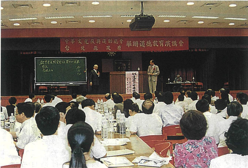
文化總會で記念講演を行う穂苅講師

「道徳教育交流」が一周年を記念して、同研究所柏生涯学習センターが主催する「道徳教育の記念講演会」が七月三日、台北県政府講堂で開かれた。