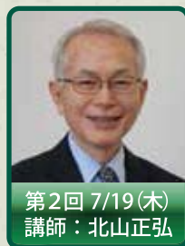
第2回 7/19(木) 講師：北山正弘