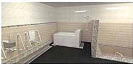
デイサービス用浴室