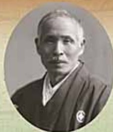
法学博士 ひろいけ ちくろう 廣池 千九郎 (1866~1938)

このような廣池の遺志に基づいて設立された畑毛記念館は、平成19年に講堂と展示室を新たに設け、平成27年には管理棟を新設。教育施設としての機能をより充実させて現在に至ります。