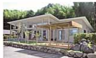
管理棟(手前は足湯)