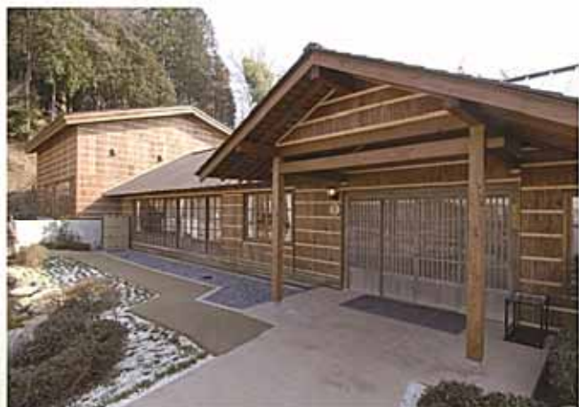
『道徳科学の論文』執筆の部屋(左奥)と富岳荘