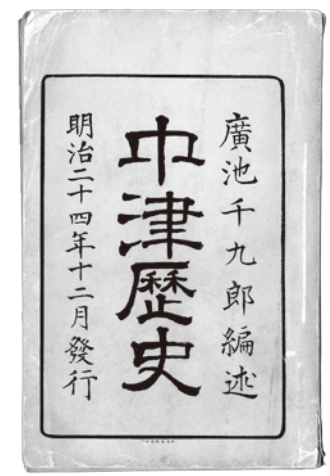
廣池千九郎著『中津歴史』1891年

03 大分の先人たちの知性と感性に学ぶ おおいた 温故知新 2016 大分の先人たちの知性と感性に学ぶ